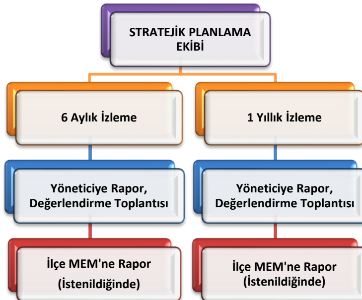
Şekil 8 Stratejik Plan İzleme ve Değerlendirme Modeli

Müdürlüğümüzün 2024-2028 Stratejik Planı İzleme ve Değerlendirme sürecini ifade eden İzleme ve Değerlendirme Modeli hazırlanmıştır. Okulumuzun Stratejik Plan İzleme-Değerlendirme çalışmaları eğitim-öğretim yılı çalışma takvimi de dikkate alınarak 6 aylık ve 1 yıllık sürelerde gerçekleştirilecektir. 6 aylık sürelerde Okul Müdürüne rapor hazırlanacak ve değerlendirme toplantısı düzenlenecektir. İzleme-değerlendirme raporu, istenildiğinde İl Millî Eğitim Müdürlüğüne gönderilecektir.