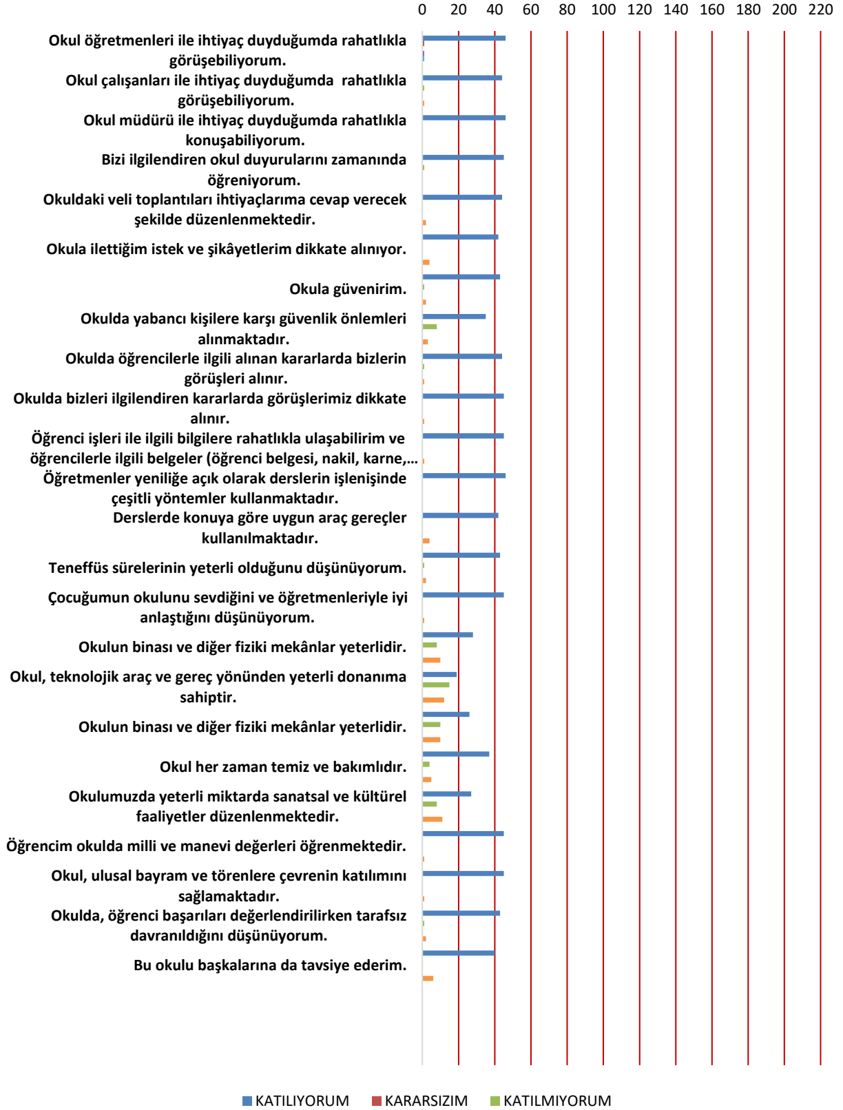
Şekil 2. Veli anketi kapsamında okulumuzu aşağıdaki ifadelerle uygun olarak değerlendiriniz.